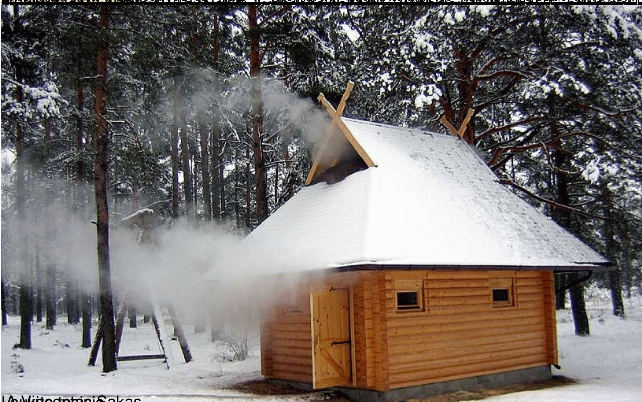
La Virtedėsis Sakas